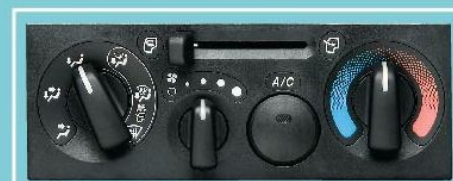
原廠AM/FM鑄射音響系統及冷氣