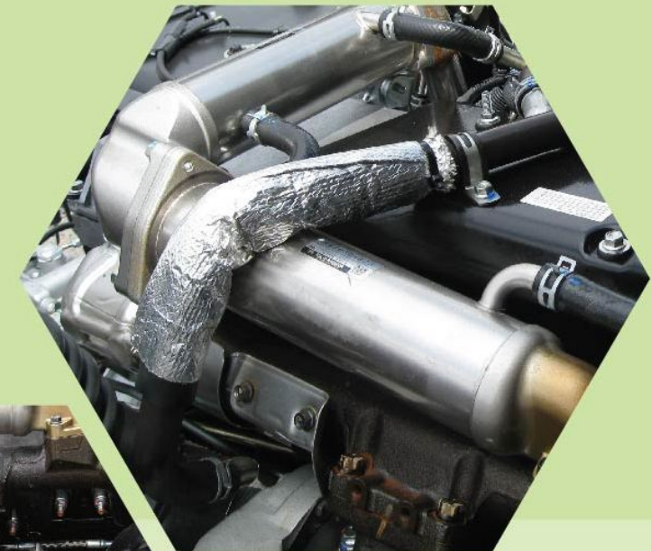
EGR廢氣再循環裝置 (Exhaust Gas Recirculation)

將部份廢氣和新鮮空氣混合輸至汽缸，有效降低最高燃燒溫度，以及減少有毒氣體排放，省油環保。