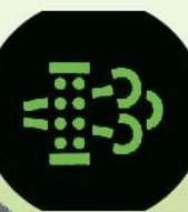
DPD柴油微粒過濾器 ( Diesel Particulate Defuser)