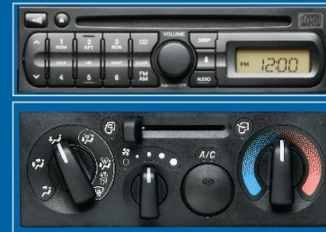
原廠冷氣及AM/FM鑲射音響系統。

革命性車廂設計，內籠空間大增，視野更為開揚，駕駛者及乘客均能乘坐舒適自在。中央控制台採用流線一體化設計，各方操控更簡易流暢、得心應手。