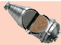
DPD柴油微粒過濾網 (Diesel Particulate Defuser)