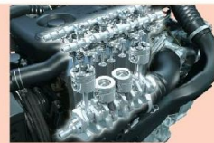
OHC頂凸輪軸，16氣門 (Over Head Cam)

生氣及排氣活門各自以一條凸輪直接驅動開啟和關閉，汽門開閉準確度更佳，從而提升汽缸在進氣和排氣時的效率。