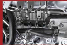
CRS電子控制高壓共軌噴注系統 (Common Rail System)

將部份廢氣和新鮮空氣混合輸至汽缸，有效降低最高燃燒溫度，以及減少有毒氣體排放，省油環保。