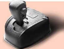
結合手動及自動波箱

生氣及排氣活門各自以一條凸輪直接驅動開啟和關閉，汽門開閉準確度更佳，從而提升汽缸在進氣和排氣時的效率。