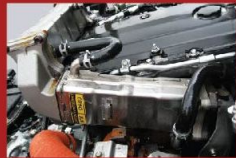
EGR廢氣再循環裝置 (Exhaust Gas Recirculation)

因應引擎操作情況，以電子訊號調校噴嘴葉片的角度，以控制進入燃燒室之空氣量，保持穩定引擎馬力輸出，並達至高度省油效果。