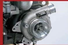
VGS可變角度渦輪增壓系統 (Variable Geometric System)

因應引擎操作情況，以電子訊號調校噴嘴葉片的角度，以控制進入燃燒室之空氣量，保持穩定引擎馬力輸出，並達至高度省油效果。