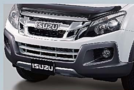
1 前泵把防護膠 Front Bumper Guard