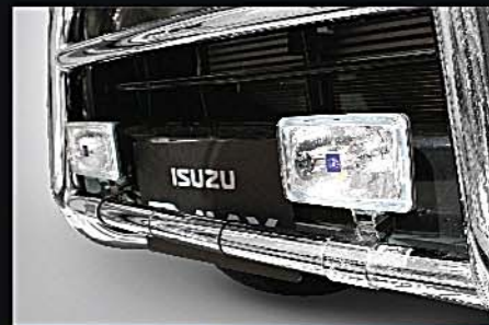
16 HELLA霧燈, COBRA燈碼 HELLA Fog Light, COBRA Light Bracket