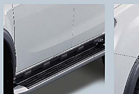
10 腳踏 Side Step