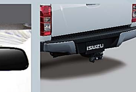
12 後視裝置 Rear View Camera