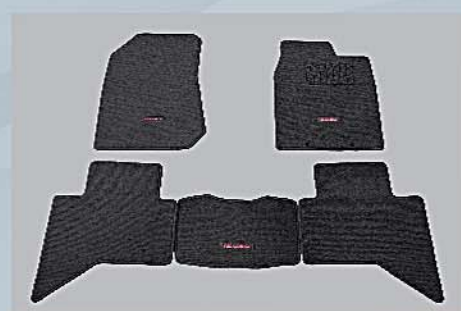
7 車廂地毯 Carpet Floor Mats