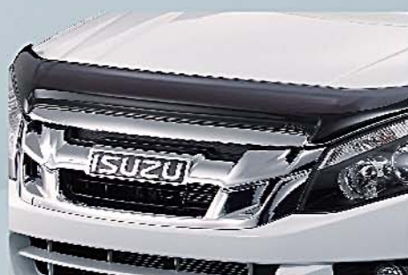
5 頭凸防石擋 Engine Hood Protector