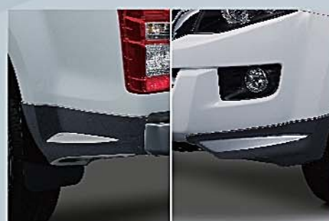
6 車側擾流組件 Skirt Set