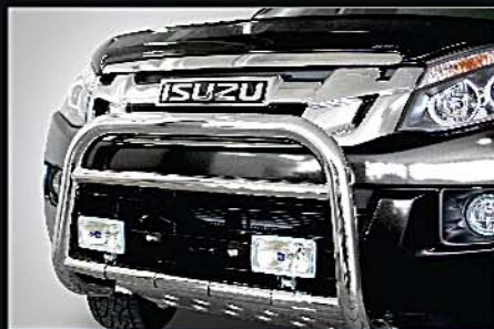
14 COBRA不鏽鋼U架 COBRA U bar