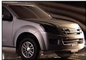
流線形車身設計，既能減低風阻，令行車更穩定。