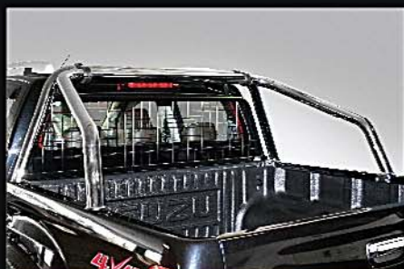
17 COBRA不鏽鋼防滾架 COBRA Roll Bar