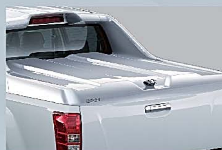
8 車斗箱 D-Box