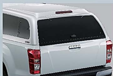
3 行李廂 Canopy