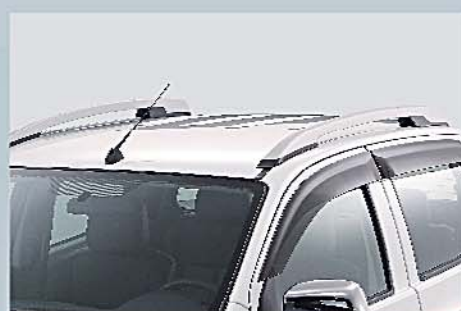
2 車頂行李架 Roof Rail