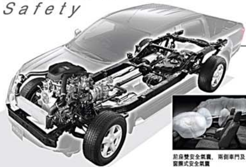
全新強化版車架及底盤，提供最佳穩定性。