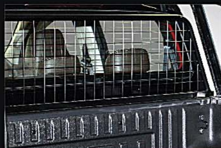
18 COBRA隔貨網 COBRA Back Window Wire Protector