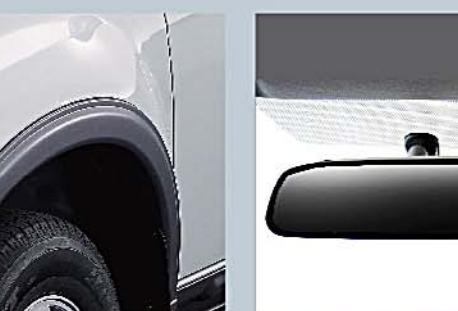
11 四門及車輪保護套件 Fender Lip and Cladding Panels