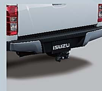
13 泊車警示器 Parking Sensor