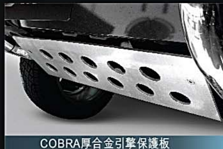
15 COBRA厚合金引擎保護板 COBRA Heavy Duty Alloy Made Skid Plate