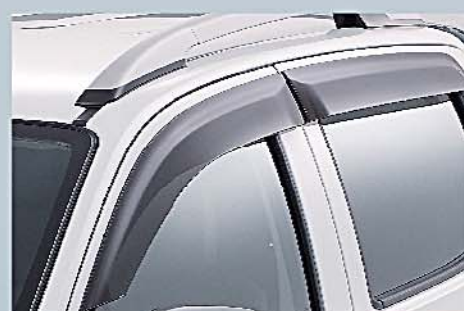
4 門邊雨擋 Door Visors