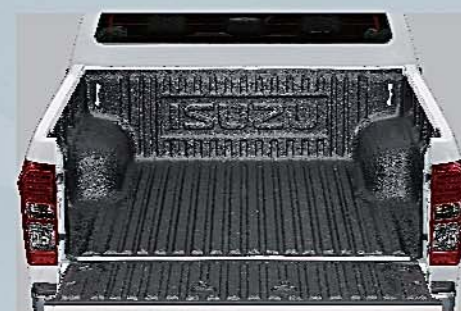
9 車斗防滑墊 Bed Liner Under Rail