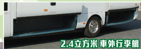
2.4立方米 車外行李艙