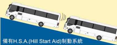
備有H.S.A. (Hill Start Aid) 制動系統

先進H.S.A. (Hill Start Aid) 制動系統，使車輛於斜坡起步時可自動鎖住車輛，駕駛者無需吊極力子，車輛也不會溜後，大大提高安全性，也令日常操作倍感輕鬆。