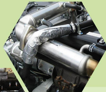
EGR廢氣再循環裝置 (Exhaust Gas Recirculation)

將部份廢氣和新鮮空氣混合輸至汽缸，有效降低最高燃燒溫度，以及減少有毒氣體排放，省油環保。