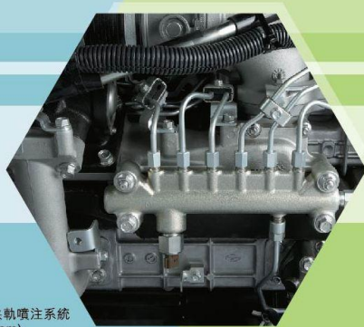
CRS電子控制高壓共軌噴注系統 (Common Rail System)