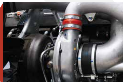
VGS可變角度渦輪增壓系統 (Variable Geometric System)

因應引擎操作情況，以電子信號調校噴嘴葉片的角，以控制進入燃燒室之空氣量，保持穩定引擎馬力輸出，並達至高度省油效果。