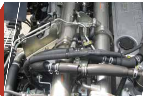
EGR廢氣再循環裝置 (Exhaust Gas Recirculation)

因應引擎操作情況，以電子信號調校噴嘴葉片的角，以控制進入燃燒室之空氣量，保持穩定引擎馬力輸出，並達至高度省油效果。