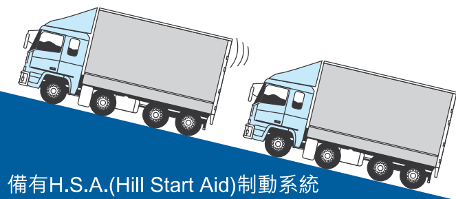
備有H.S.A.(Hill Start Aid)制動系統

先進H.S.A. (Hill Start Aid) 制動系統，使車輛於斜路起步時可自動鎖住車輛，駕駛者無需吊極力子，車輛也不會溜後，大大提高安全性，也令日常操作倍感輕鬆。