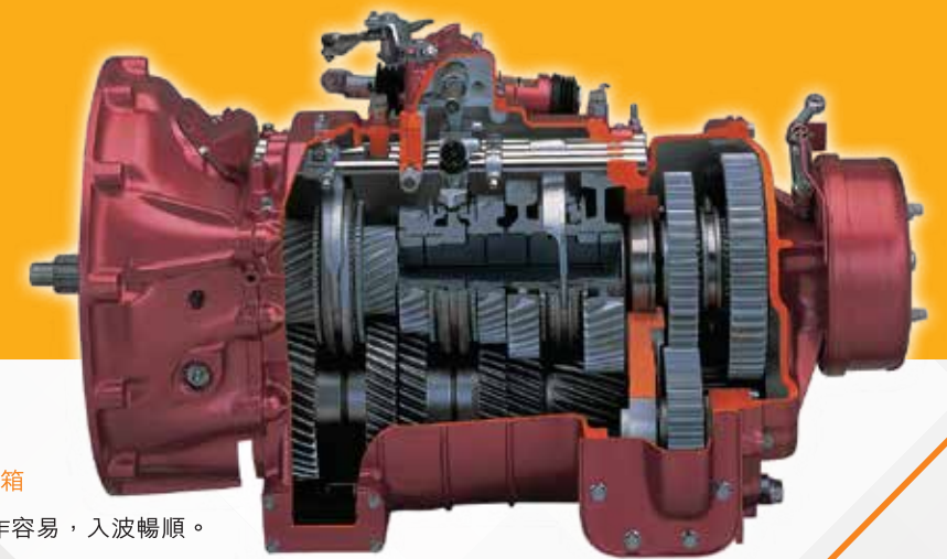
7前速超速檔鋁合金波箱

新一代CYH52採用先進五十鈴6WG1E6N 24氣閥、VGS可變角度渦輪增壓系統，馬力輸出高達420匹，扭力最高可達190公斤-米。加上7前速超速檔鋁合金波箱，行車加倍順暢穩定。