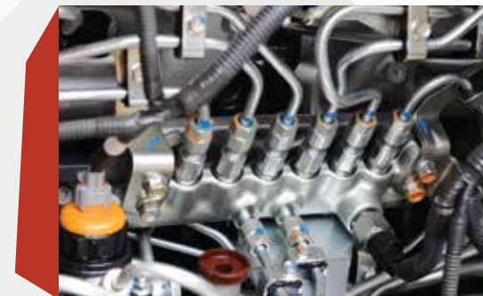
CRS電子控制高壓共軌噴注系統 (Common Rail System)