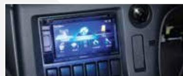
高級鐳射音響系統