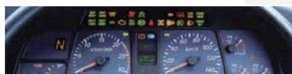
MID電腦多功能顯示器