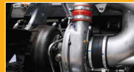
VGS可變角度渦輪增壓系統 (Variable Geometric System)

因應引擎操作情況，以電子信號調校噴嘴葉片的角度，以控制進入燃燒室之空氣量，保持引擎馬力穩定輸出，並達至高度省油效果。