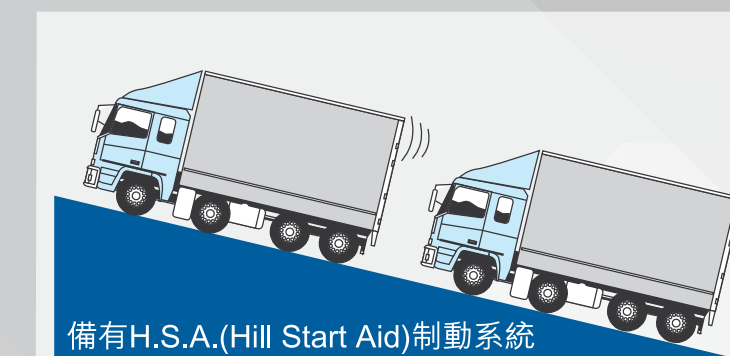
備有H.S.A.(Hill Start Aid)制動系統

先進H.S.A. (Hill Start Aid) 制動系統，使車輛於斜路起步時可自動鎖住車輛，駕駛者無需吊極力子，車輛也不會溜後，大大提高安全性，也令日常操作倍感輕鬆。