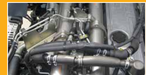
EGR廢氣再循環裝置 (Exhaust Gas Recirculation)

因應引擎操作情況，以電子信號調校噴嘴葉片的角度，以控制進入燃燒室之空氣量，保持引擎馬力穩定輸出，並達至高度省油效果。