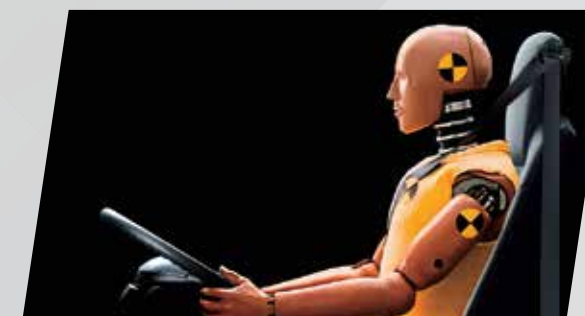
3點式ELR緊急鎖定縮回安全帶