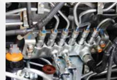
CRS電子控制高壓共軌噴注系統 (Common Rail System)

新一代CYZ52採用先進五十鈴6WG1E6N 24氣閥、VGS渦輪增壓柴油引擎，馬力輸出高達420匹，扭力最高可達190公斤-米。加上7前速超速檔鋁合金波箱，行車加倍順暢穩定。