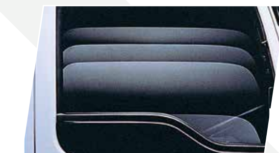
電動車窗及中央門鎖