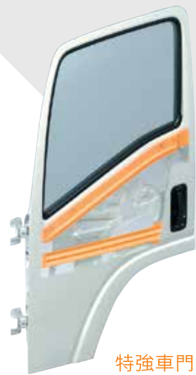
特強車門防撞骨架