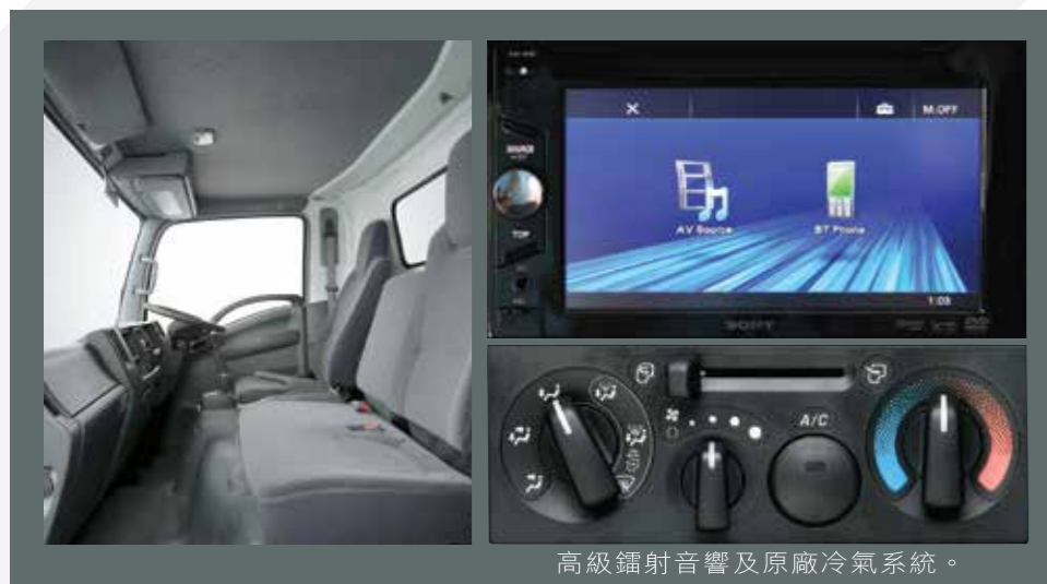
高級鐳射音響及原廠冷氣系統。