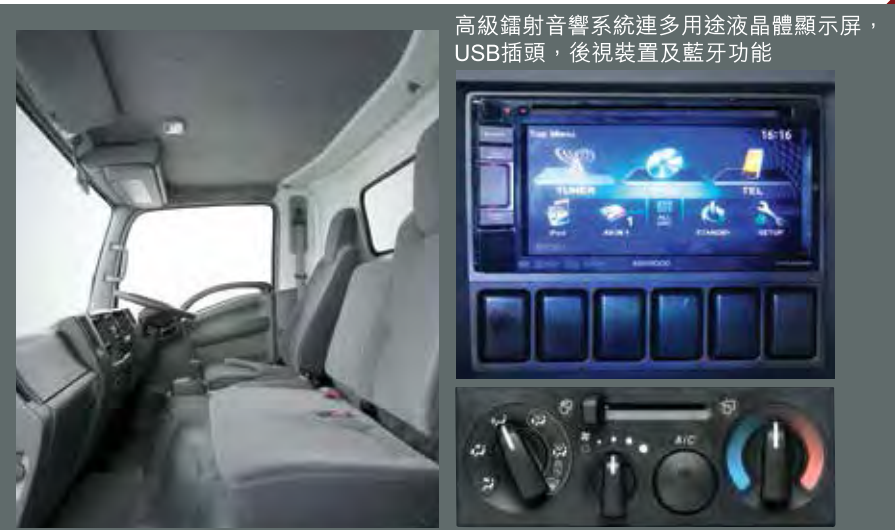
高級鑼射音響系統連多用途液晶顯示屏，USB插頭，後視裝置及藍牙功能