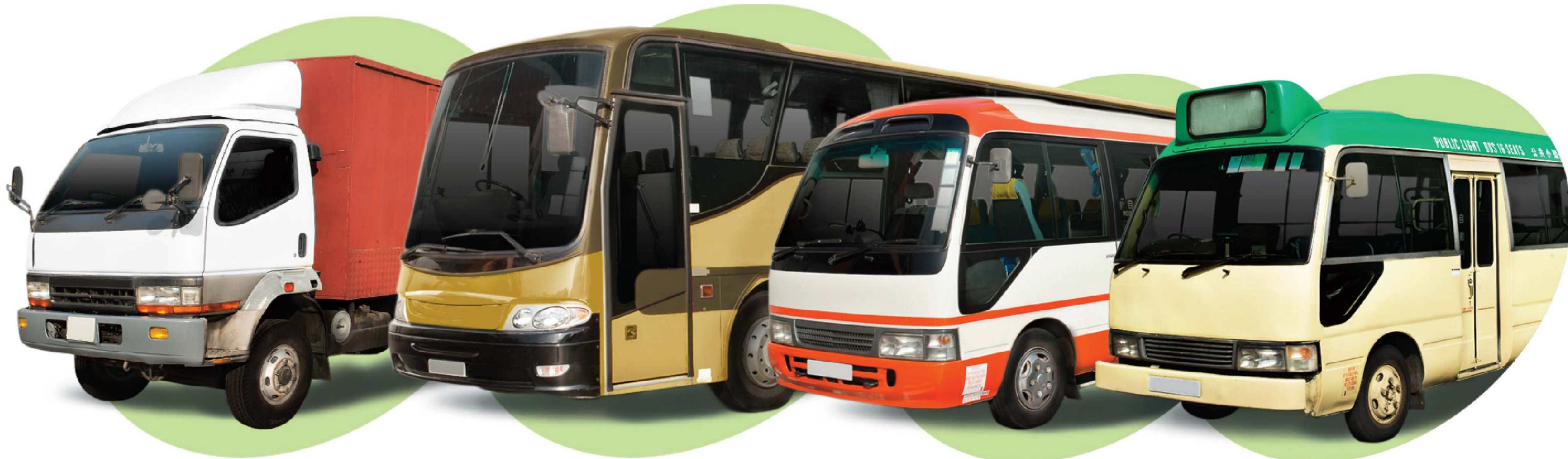
貨車 Goods Vehicles