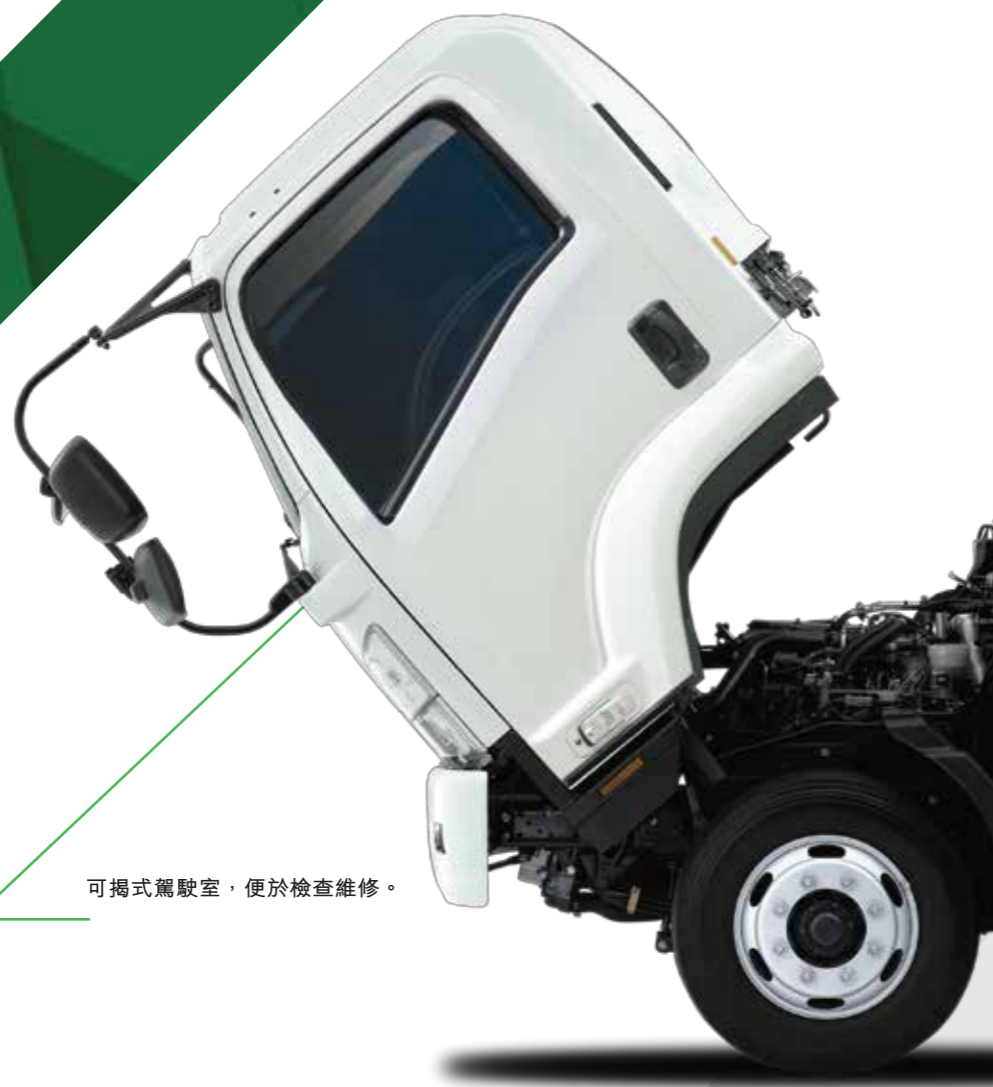
可揭式駕駛室，便於檢查維修。