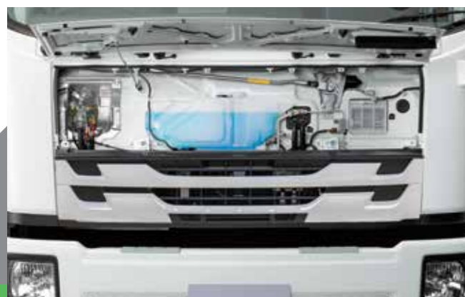
前置檢查裝置，日常檢查簡單便利。