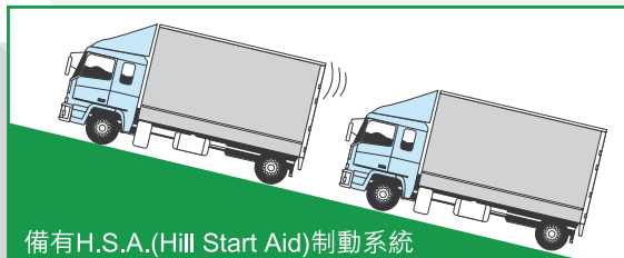
備有H.S.A.(Hill Start Aid)制動系統