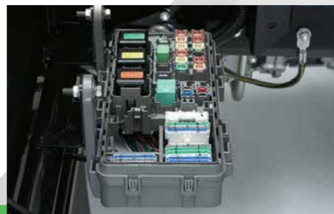
全新設計保險絲，更換及檢查更為方便。