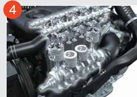
4 DOHC雙頂凸輪軸，16氣門 (Double Over Head Cam) (只適用於NHR87型號)

生氣及排氣活門各自以一條凸輪直接驅動開啟和關閉，汽門開閉準確度更佳，從而提升汽缸在進氣和排氣時的效率。