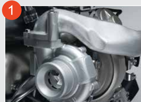
1 VGS可變角度渦輪增壓系統 (Variable Geometric System)

由於DPD再生時微量柴油可能混和引擎潤滑油，日常使用時請定期檢查引擎潤滑油水平，發現到達油尺“X”位時請更換引擎潤滑油。