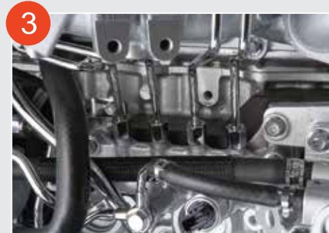
3 CRS電子控制高壓共軌噴注系統 (Common Rail System)

將部份廢氣和新鮮空氣混合輸至汽缸，有效降低最高燃燒溫度，以及減少有毒氣體排放，省油環保。