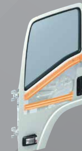
特強車門防撞骨架