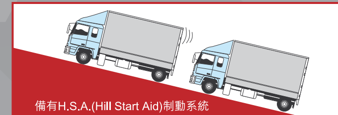
備有H.S.A.(Hill Start Aid)制動系統

全新五十鈴NHR87/NMR85車系引入多項先進安全裝置，包括ABS防鎖制動系統，可精確控制每個車輪的制動力，提供更穩定安全的制動表現。加上一系列安全配備，全面提升安全度，為駕駛者提供最周全的保障。