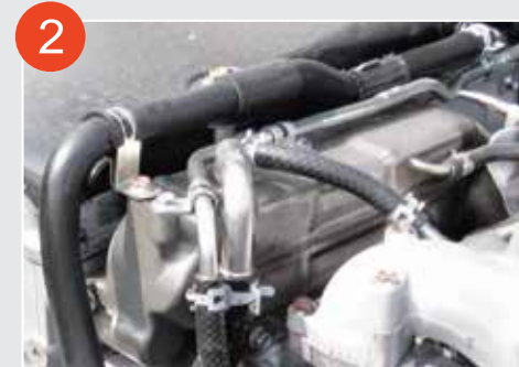
2 EGR廢氣再循環裝置 (Exhaust Gas Recirculation)

因應引擎操作情況，以電子訊號調校噴嘴葉片的角位，以控制進入燃燒室之空氣量，保持穩定引擎馬力輸出，並達至高度省油效果。