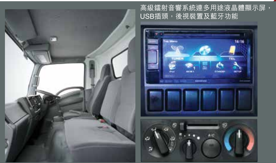
高級鑼射音響系統連多用途液體顯示屏，USB插頭，後視裝置及藍牙功能